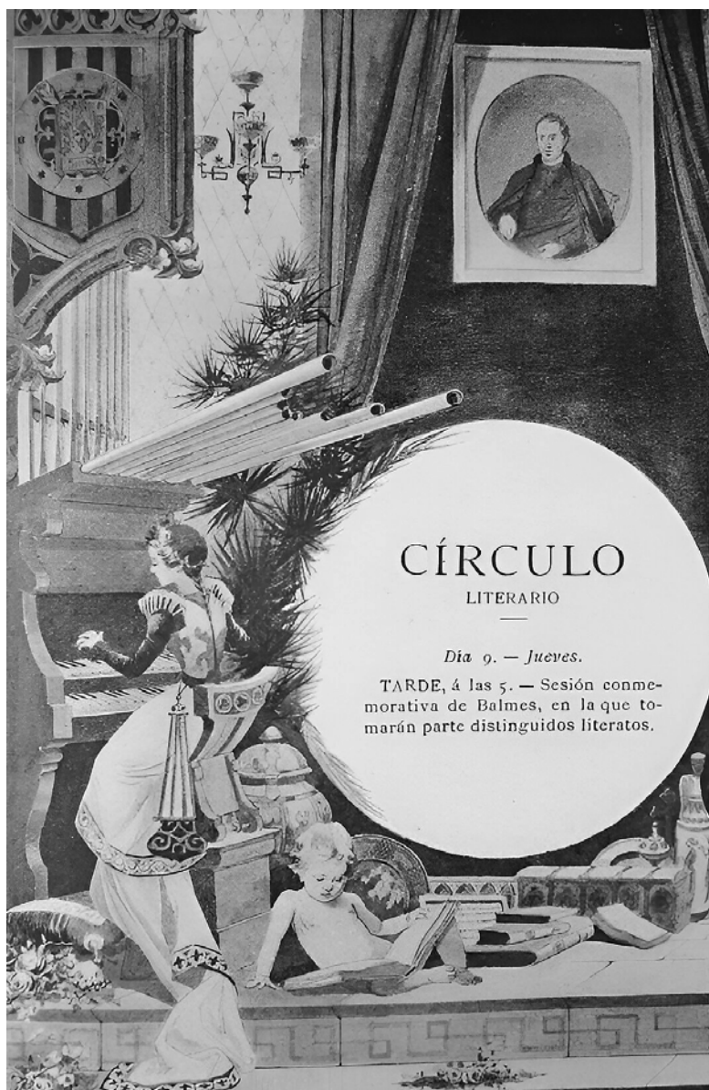
Imatge 2. Sessió commemorativa balmesiana, dins el Programa de Festa de Major de Vic de 1896